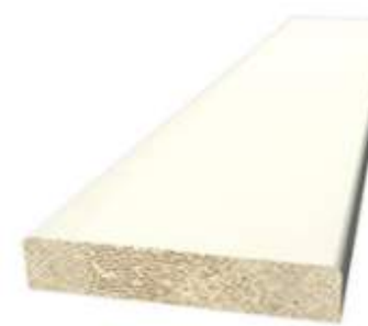
187 045 Foglist 8x33 mm vitmålad (runt taklucka)