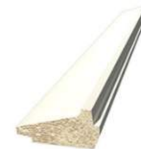
187 030 Skugglist 21x43 mm vitmålad