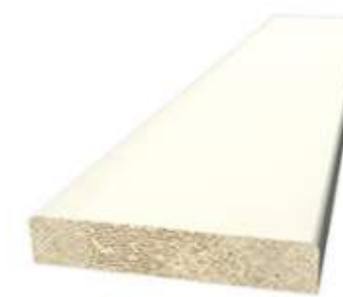
187 045 Foglist 8x33 mm vitmålad (runt taklucka)