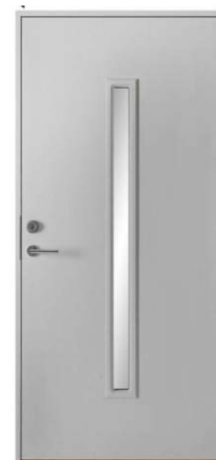
Ytterdörr från Lervikssortiment

Ytterdörr har säker konstruktion, tät, tyst och energisnål med fabriksmonterad tätning i falsen mellan dörrbladet och karmen. U-värde: 1,0. Konstruktion i furuträ med 51 mm värmeisolering, samt 0,5 mm aluminiumplåt på både in och utsida av dörren. Låset, samt handtaget är från ASSA