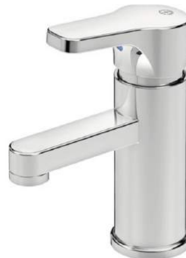
Tvättställsblandare GUSTAVSBERG Nepthun