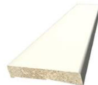
230 920 Golvsockel 12x69 mm vitmålad