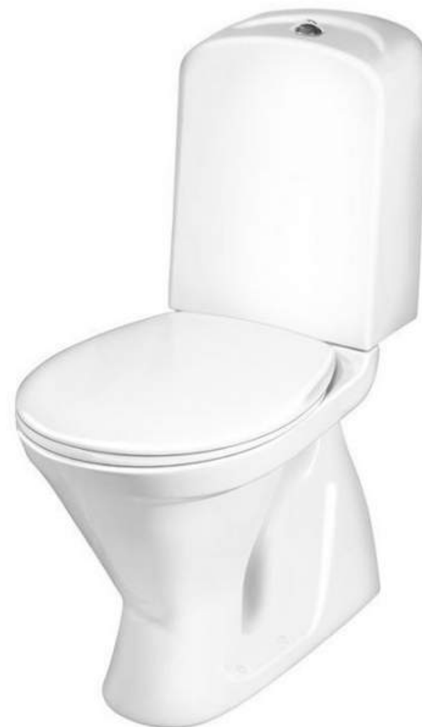
TOALETT GUSTAVSBERG NORDIC 3 3500 INK STANDARDSITS