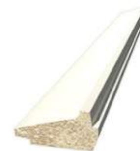
187 030 Skugglist 21x43 mm vitmålad