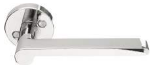
Dörrhandtag från ASSA s sortiment

Ytterdörr har säker konstruktion, tät, tyst och energisnål med fabriksmonterad tätning i falsen mellan dörrbladet och karmen. U-värde: 1,0. Konstruktion i furuträ med 51 mm värmeisolering, samt 0,5 mm aluminiumplåt på både in och utsida av dörren. Låset, samt handtaget är från ASSA