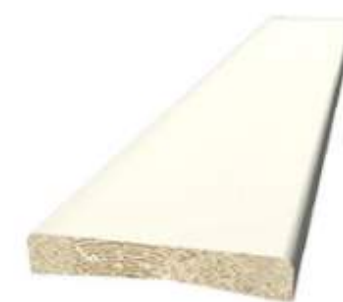
240 915 Foder 12x56 mm vitmålad

Dörrfoder, golvsockel, taklist och foglist